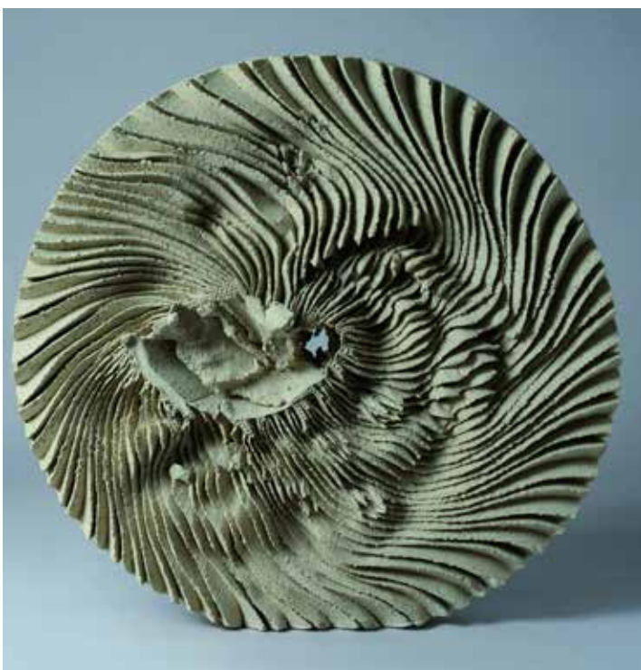
"Römhild-Rad", Marc Leuthold, USA