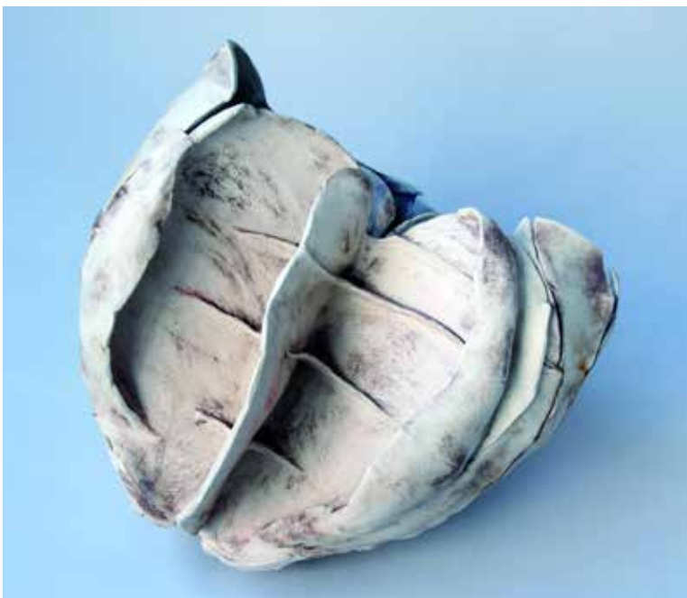
"Kapsel", Gudrun Petzold, Deutschland