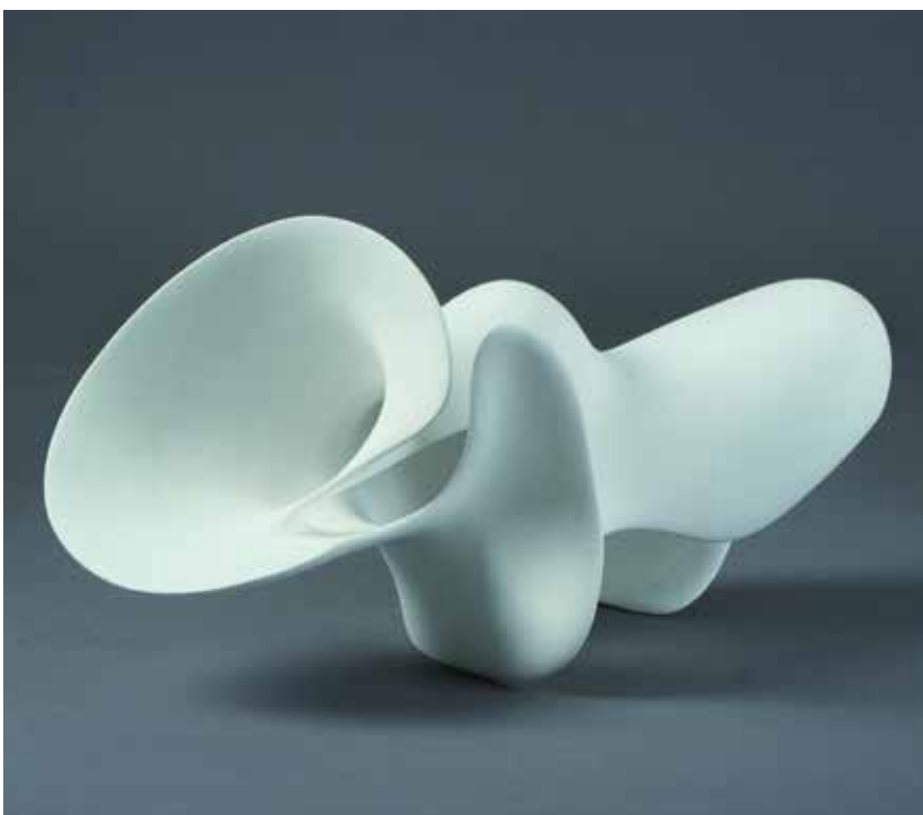
"Dwelling in Infinite Brightness", Chih-Chi Hsu, Taiwan