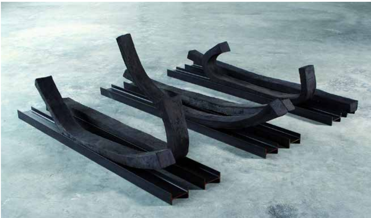
"Panta Rhei", Aysegül Eren, Belgien