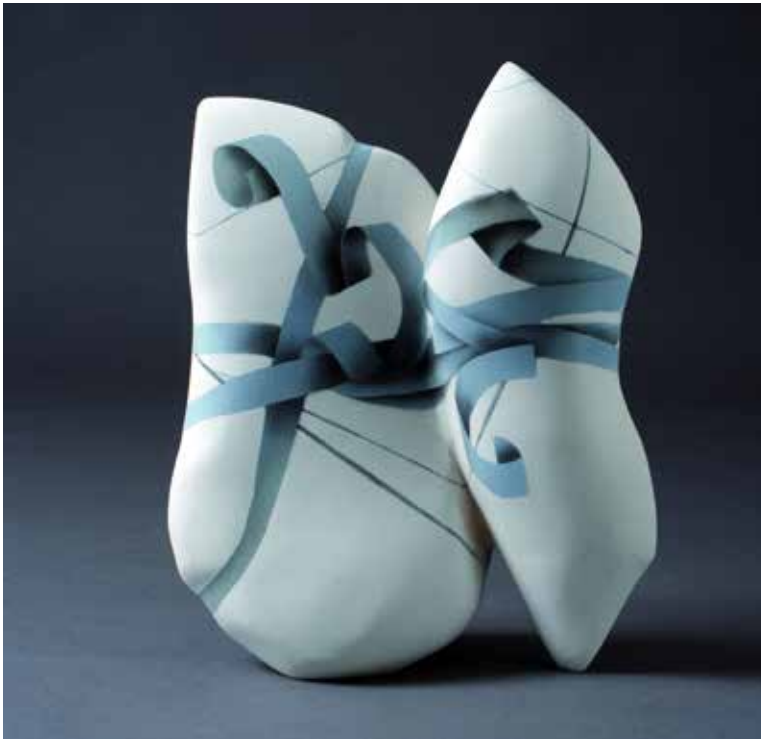
"Pair", Velimir Vukicevic, Serbien