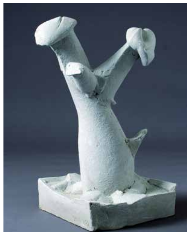
"Pflanze im Blumentopf", Qi Wang, China