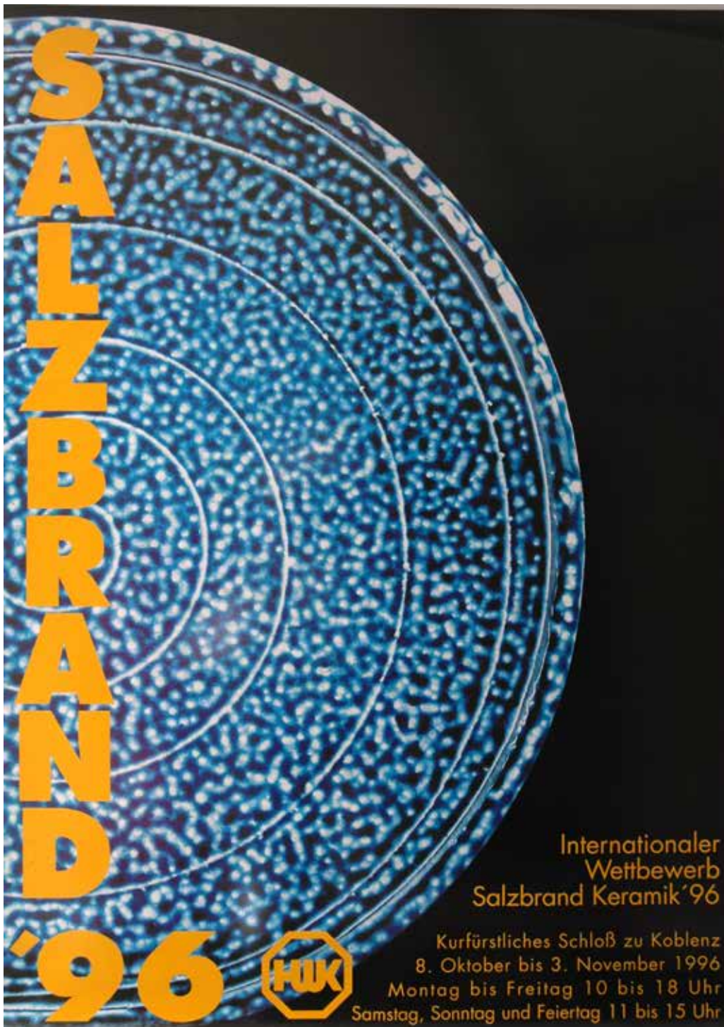
Plakat zur Ausstellung