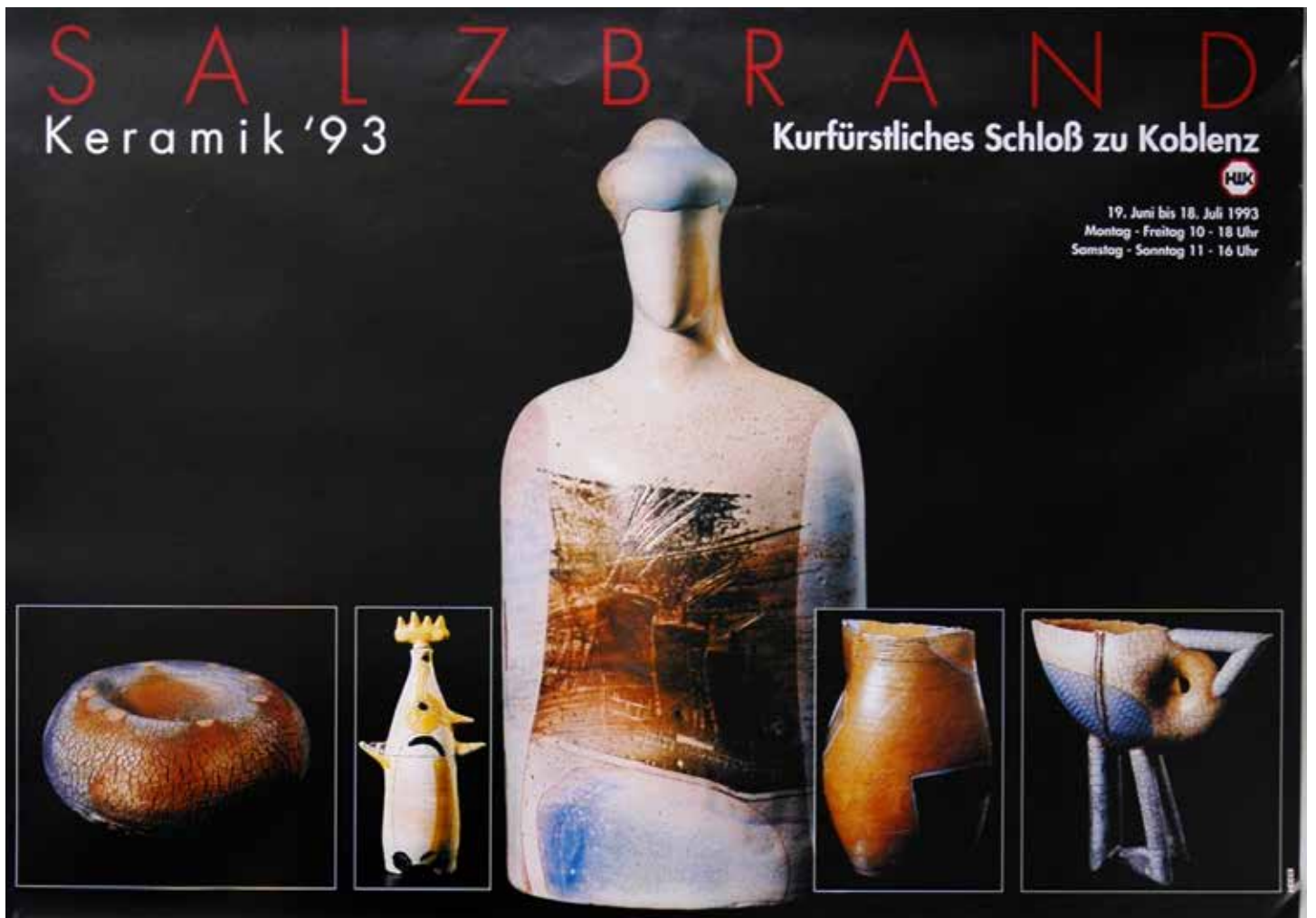
Plakat zur Ausstellung