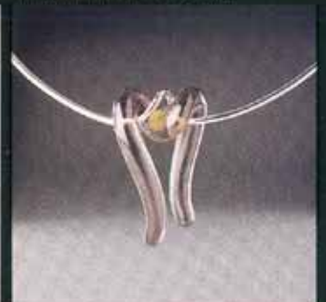
Alfred Bauer, Idar-Oberstein 1