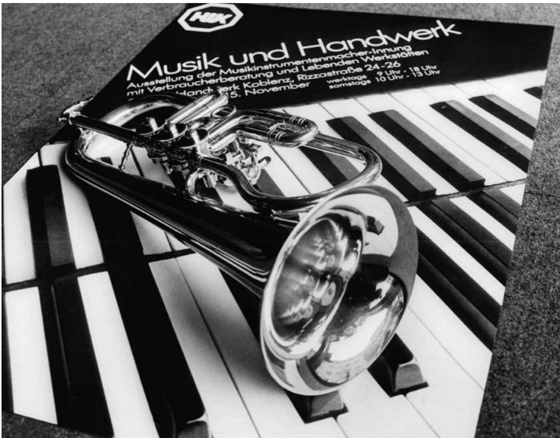
Werbefoto und Bildschirmtext