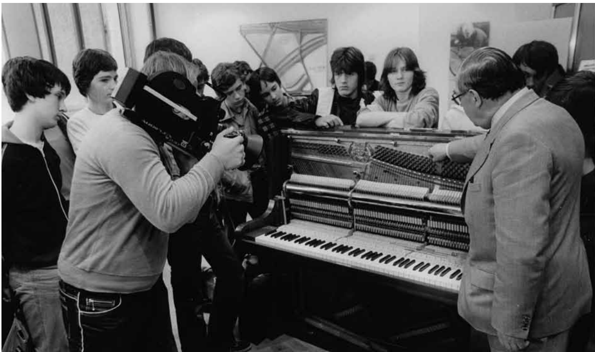
Musikinstrumentenmacher-Innung Koblenz-Trier